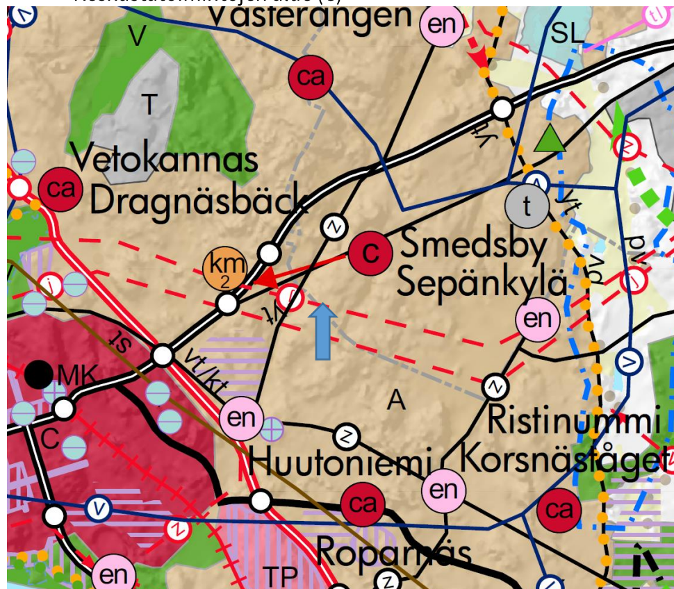
Kuva 1. Alueen sijainti Pohjanmaan maakuntakaavassa 2040 on merkitty sinisellä nuolella.