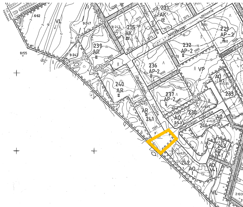
Kuva 4. Alueen sijainti asemakaavassa on merkitty keltaisella.

Alueen 19.6.1985 hyväksytyssä rakennuskaavassa alueella on merkintä VL (lähivirkistysalue).