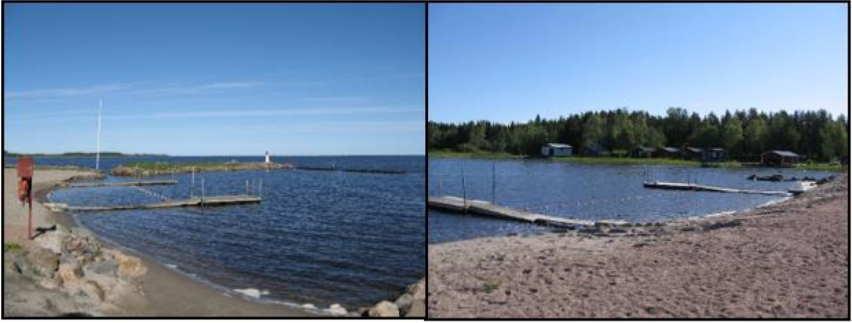
Kuva1. Harrströmin uimaranta lähiympäristöineen.