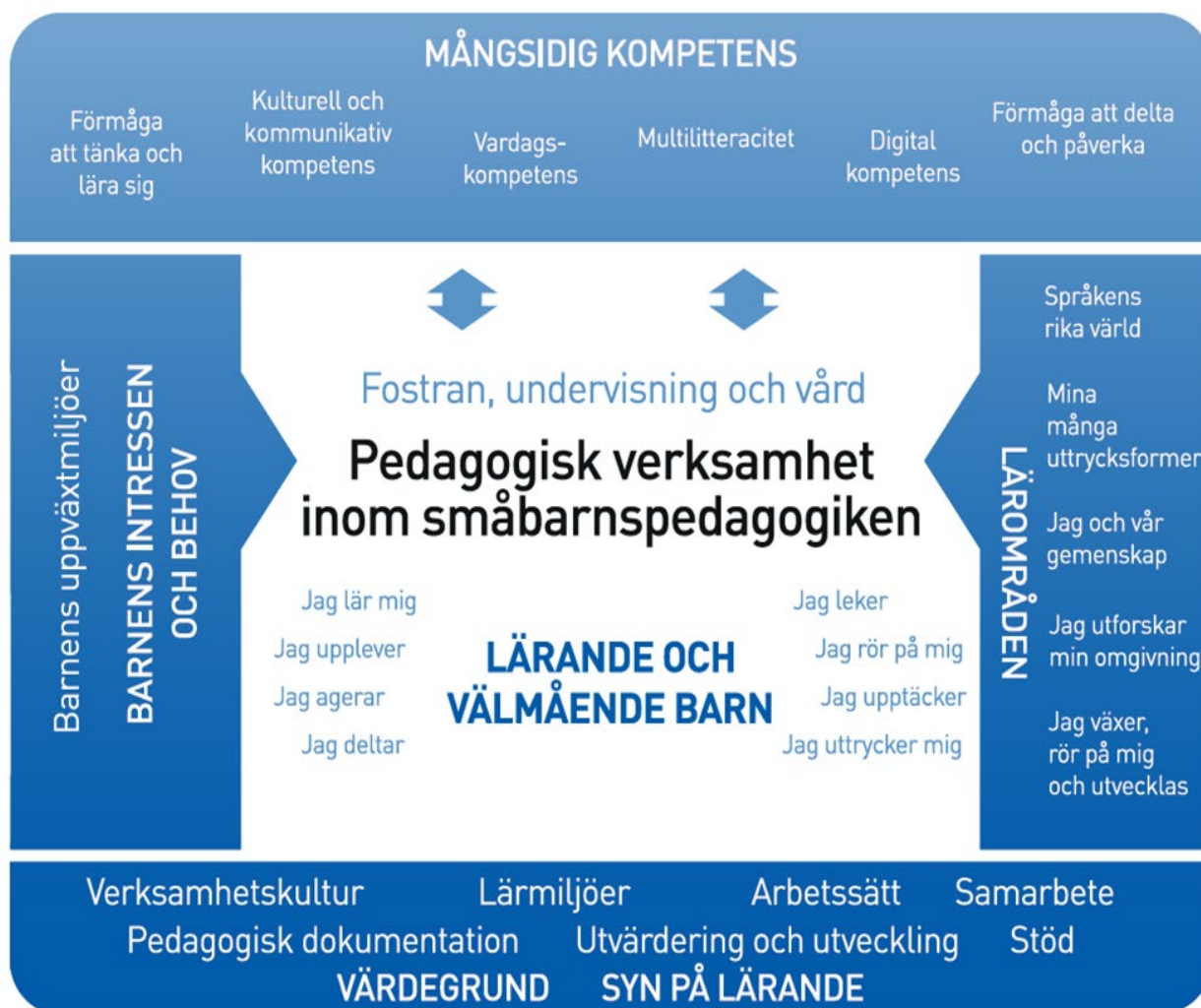
Referensramen för den pedagogiska verksamheten.

Utgångspunkter för verksamheten ska vara: