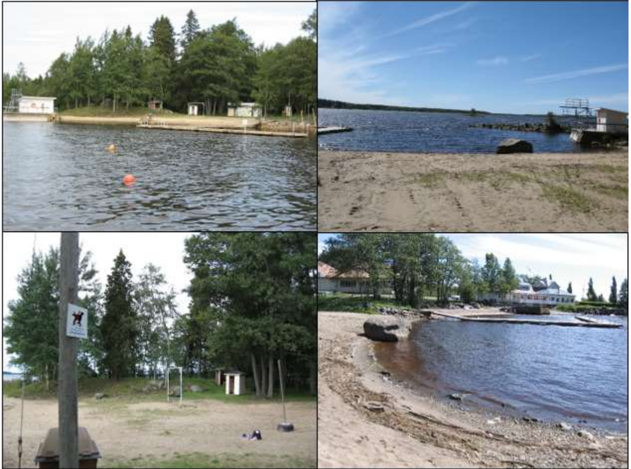
Foto 1. Åminne badstrand.