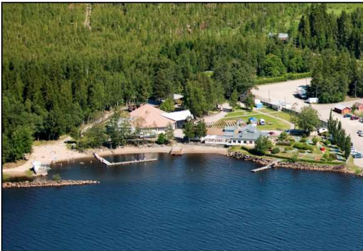
Figur 3. Flygfotografi av Åminne badstrand och dess näromgivning.