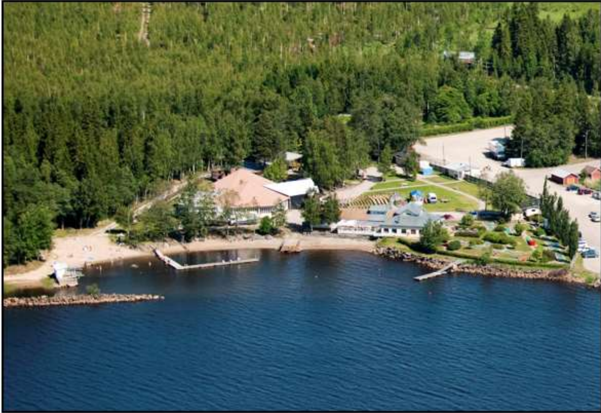
Kuva 3. Ilmakuva Åminnen uimarannasta lähiympäristöineen.