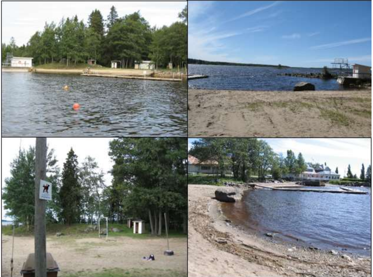
Kuva 1. Åminnen uimaranta.