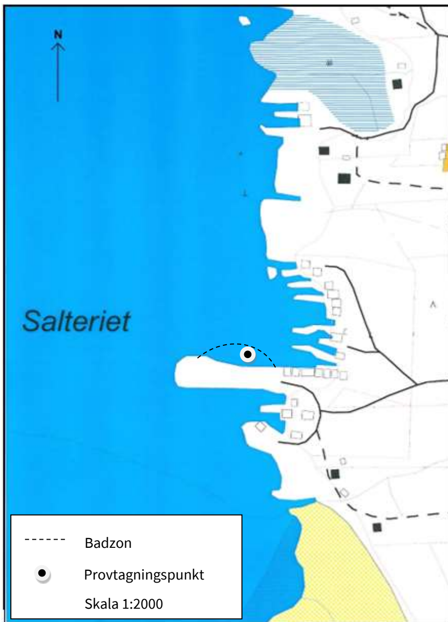
Figur 2. Harrström badstrand med badzon och provtagningspunkt utmärkt (1:2000).