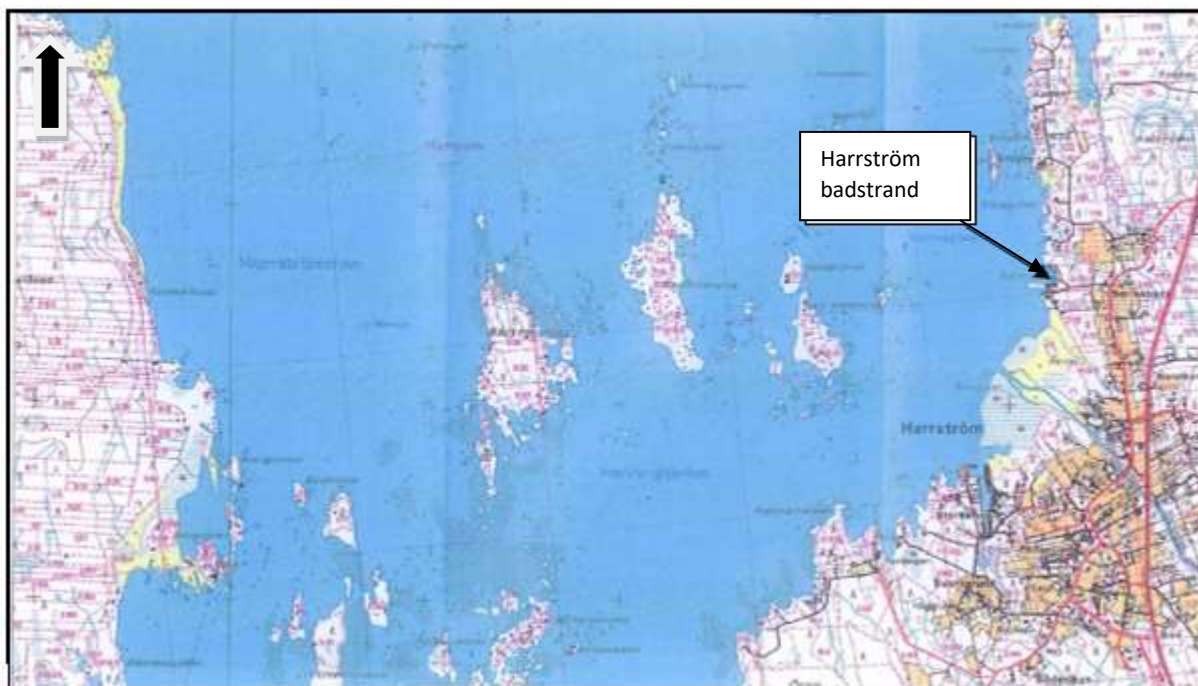
Figur 1. Harrström badstrand med omgivning (1: 20 000)