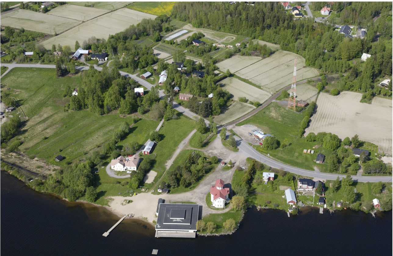
Kuva 2. Vanha ilmakuva Karperön uimarannasta lähiympäristöineen. Kuvassa paviljongin molemmin puolin näkyvät rakennukset on sittemmin purettu.