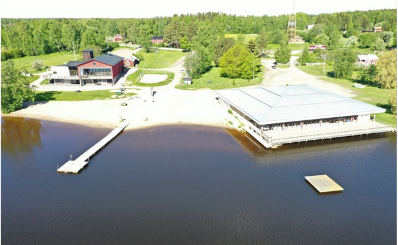
Kuva 3. Karperön uimaranta kesäkuussa 2022. Ranta rajautuu lännessä ja pohjoisessa Karperön nuorisoseuran tiloihin Carpella Strandlidiin ja Carpella Paviljongiin ja etelässä kasvillisuuteen