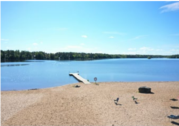
Kuva 1. Karperön uimaranta kesäkuussa 2022.

Karperöfjärdenin kasvillisuus on kartoitettu vuonna 2004. Kasvillisuus järven rannoilla on runsasta erityisesti järven keskivaiheilla, jossa uimaranta sijaitsee. Tavallisimpia lajeja ovat ruskoärviä ( Myriophyllum alterniflorum ), ahvenvita ( Potamogeton perfoliatus ) ja siimapalpakko ( Sparganium gramineum ).