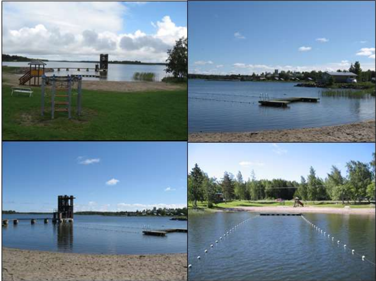
Kuva1. Moikipään uimaranta lähiympäristöineen.

Ranta rajautuu etelässä nurmikkoon, jolla kasvaa puita, muun muassa harmaaleppää ( Alnus incana ) ja koivua ( Betula pubescens ).