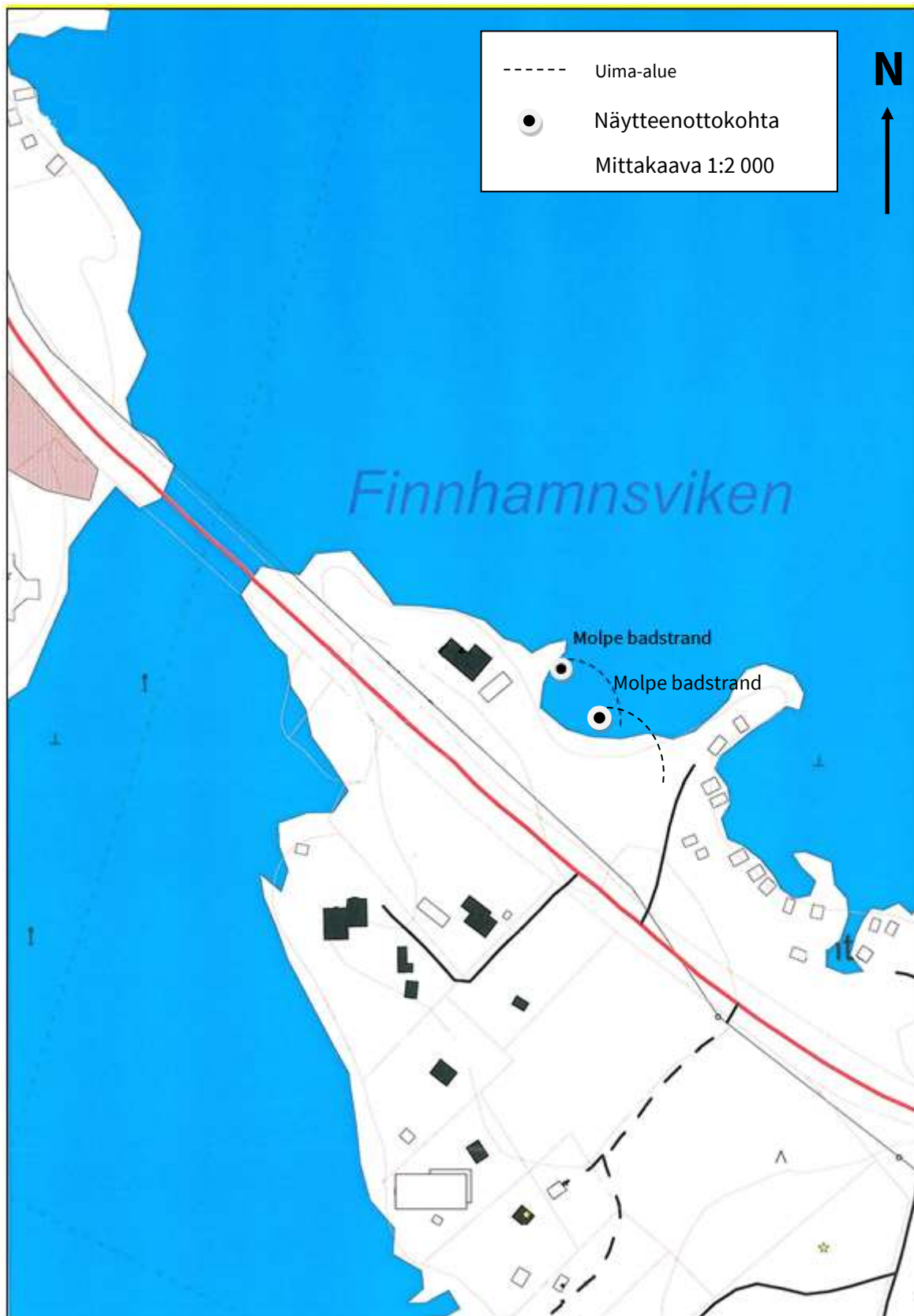
Kuvio 2. Moikipään uimaranta ja uima-alue sekä näytteenotto kohta (1:2 000).