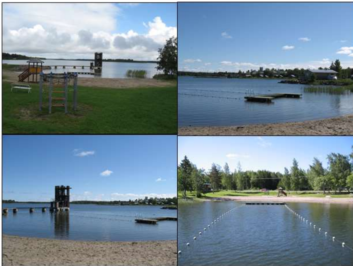
Foto 1. Molpe badstrand och dess näromgivning.

Badstrandens strandlinje är ca 55 m lång. Strandzonen med finkorig sand är ca 25–30 m bred och ovanför sandzonen finns gräsmatta (Foto 1). Lite vass växer vid östra delen av strandlinjen. Västra delen av stranden avgränsas av en stenpir/brygga som går ut till hopptornet. Stranden avgränsas i söder av gräsmatta som har inslag av träd bl.a. gråal ( Alnus incana ) och björk ( Betula pubescens ).